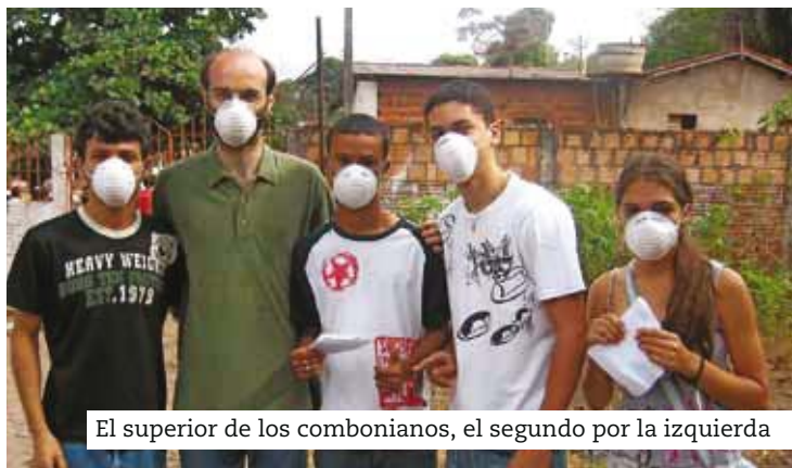
El superior de los combonianos, el segundo por la izquierda